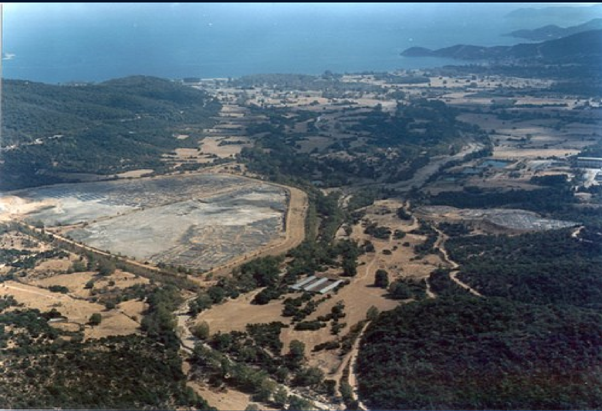
Η εικόνα της Ολυμπιάδας σήμερα